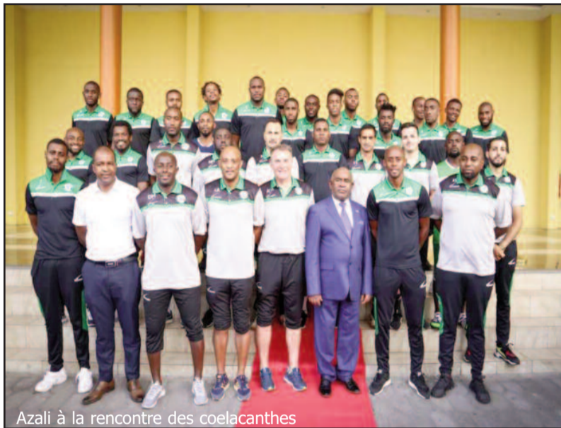
Azali à la rencontre des coelacanthés

Le jeudi 5 septembre dernier, les Cœlacanthes et le staff ont eu l'honneur de recevoir la visite de courtoisie du président Azali Assoumani, en présence du ministre des sports, et d'autres hautes personnalités sportives. Une telle visite doit revêtir diverses significations. A la veille d'un duel déterminant (Comores # Togo), la présence du président apporte au groupe une motivation supplémentaire, et illustre la volonté des autorités nationales à accompagner les Cœlacanthes.