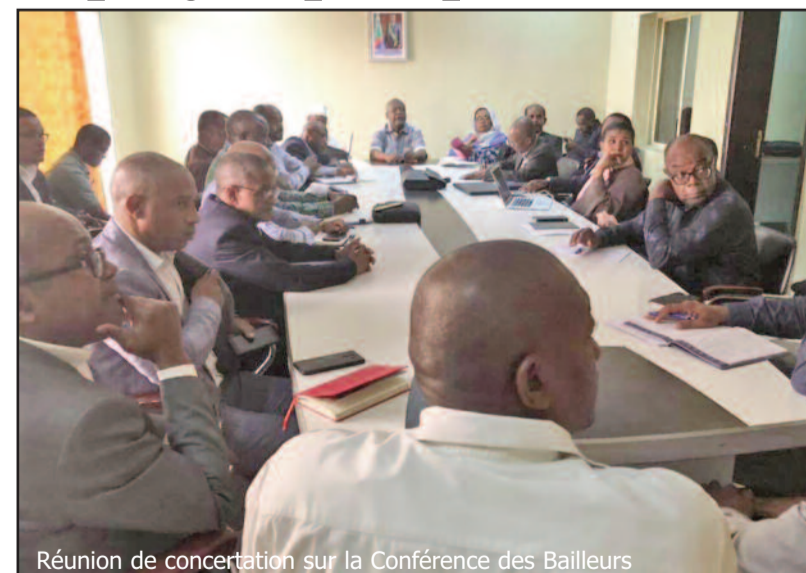
Réunion de concertation sur la Conférence des Bailleurs

Quant aux projets structurants, ils s'articulent autour de la construction et de la réhabilitation des routes nationales, de la construction du