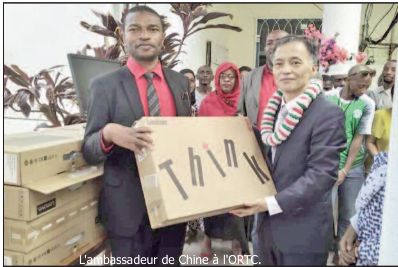
L'ambassadeur de Chine à l'ORTC.

L'ambassadeur de la République Populaire de Chine a effectué hier dans la matinée, une visite de courtoisie à l'Office de Radio et Télévision des Comores. He Yanjun n'est pas venu les mains vides. Comme à leur habitude, les chinois ont apporté du nouveau matériel (équipement informatique) à la station pour les aider à améliorer leurs conditions de travail. « Je suis venu vous rendre visite mais aussi vous apporter quelques cadeaux, qui, j'espère bien, seront utiles dans vos travaux quotidiens »,